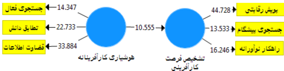
شکل ۲- مدل ساختاری پژوهش در حالت معناداری Figure 2. Path Model with t-Value

ایلام توسط متغیرهای نهفته‌ی هوشیاری کارآفرینانه قابل پیش‌بینی است. اندازه اثر f^2 : این معیار که توسط کوهن (۵) معرفی شد، شدت رابطه‌ی میان سازه‌های مدل را تعیین می‌کند. طبق نظر کوهن، مقادیر 0/02 ، 0/15 و 0/35 ؛ به ترتیب نشان از تأثیر کوچک، متوسط و بزرگ یک سازه بر سازه‌های دیگر دارند (۵). براساس نتایج ارائه شده در جدول ۶؛ اندازه‌ی اثر متغیر نهفته‌ی هوشیاری کارآفرینانه بر قابلیت تشخیص فرصت‌های کارآفرینی برابر 0/49 بود که اندازه‌ی اثر بالایی می‌باشد. ارتباط پیش‌بین Q^2 : این معیار توسط استون و گیزر (۳۲) معرفی شد و قدرت پیش‌بینی مدل را مشخص می‌کند. هنسler و همکاران (۹) در مورد شدت قدرت پیش‌بینی مدل برای