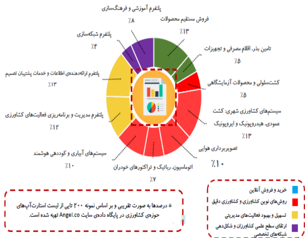
شکل ۱- فراوانی کسب‌وکارهای نوپای کشاورزی به تفکیک زنجیره فعالیت‌ها (۱۰) Figure 1. Frequency of start-up agricultural businesses by chain of activities

طراحی مدل خروج کارآفرینانه با تأکید بر فرسودگی شغلی در کسب‌وکارهای نوپای کشاورزی کشور و اهداف فرعی آن سطح‌بندی و خوشه‌بندی مؤلفه‌های خروج کارآفرینانه با تأکید بر فرسودگی شغلی است. اکثر صاحب‌نظران فرآیند کارآفرینی را شامل شش بخش آغاز، باروری، طفولیت، نوجوانی، رشد و بلوغ می‌دانند، اما محققان فرآیند کارآفرینی را بدون خروج، کامل نمی‌دانند و مرحله خروج را نیز به مراحل قبلی افزوده‌اند (Nouri et al., 2015). علی‌رغم تصور عامه، خروج کارآفرینانه مترادف شکست کسب‌وکارها نیست و بسیاری از کارآفرینان خارج شده با کسب تجربه بیشتر و یادگیری از فعالیت‌های قبلی، دوباره به حرفه قبلی یا جدید وارد می‌شوند (Sadeghi et al., 2019). خروج می‌تواند هم نتیجه موفقیت بوده و به‌صورت داوطلبانه اتفاق بیفتد و هم ناشی از شکست بنگاه باشد و به اجبار رخ دهد (Talebi et al., 2019). محققان بر اساس حالت‌های مختلف خروج (فروش و انحلال) و عملکرد اقتصادی بنگاه (عملکرد بالا یا پایین) چهار حالت خروج را تعریف کرده‌اند: ۱- شکست کارآفرینانه (تعطیلی با عملکرد پایین)، ۲- انتخاب واگذاری (تعطیلی با عملکرد بالا)، ۳- چرخش مدیریتی (فروش با عملکرد پایین)، ۴-