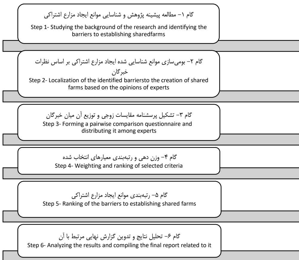
شکل ۱- مراحل اجرایی تحقیق Figure 1. Steps of the research