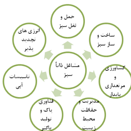
شکل ۲- مشاغل ذاتاً سبز برگرفته از نتایج روش تحقیق گرند تئوری Figure 2. Inherently green jobs derived from Grounded Theory Method

با توجه به عدم وجود طبقه‌بندی مناسب و کاربردی در خصوص مشاغل سبز، بر اساس نتایج حاصل از داده‌های تحقیق، مفاهیم و مقولات به صورت ذیل طبقه‌بندی شد. ۱- شغل‌های ذاتاً سبز با رویکرد اقتصاد سبز (کاهش تولید و انتشار کربن، کارآمدی انرژی) که مشاغل حوزه کشاورزی و مرتعداری در این گروه قرار می‌گیرند.