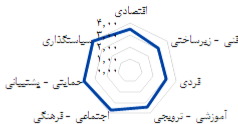
نمودار ۲- عوامل بازدارنده توسعه کارآفرینی در زمینه انرژی‌های تجدیدپذیر در بخش کشاورزی Figure 2. Kite diagram of barrier to entrepreneurship development in the field of renewable energy

همان‌گونه که در بخش نتایج مشاهده شد، در عامل سیاست‌گذاری وجود مقررات دست و پاگیر در جهت اخذ تسهیلات بانکی و توجه ناکافی به توسعه کارآفرینی در سیاست‌گذاری‌های کلان کشور دارای بالاترین اولویت‌ها می‌باشند، که قوانین و مقررات رایجی که جهت سرمایه‌گذاری در جهت توسعه کارآفرینی در زمینه انرژی‌های تجدیدپذیر در