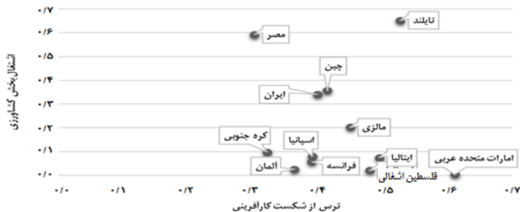
شکل ۱- مقایسه ترس از شکست کارآفرینی در کشورهای مورد مطالعه در سال ۲۰۱۷

شکل (۱) مقایسه ترس از شکست کارآفرینی و کشاورزی را در کشورهای مورد مطالعه نشان می‌دهد. بر این اساس،