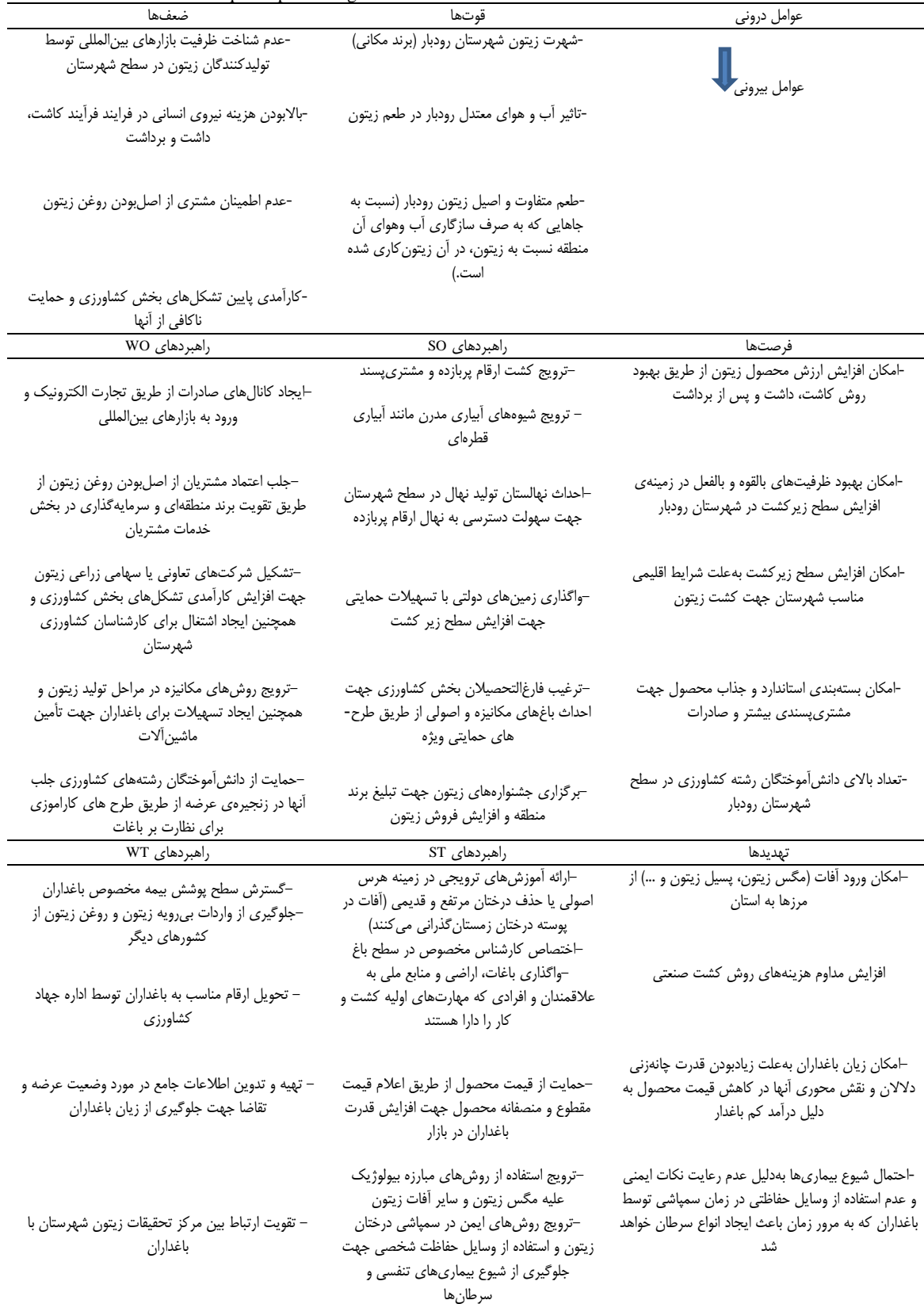
Table 5. Policies related to quadruple strategies within the frame work SWOT