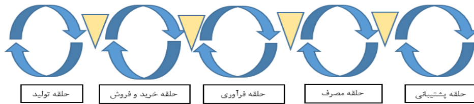
شکل ۱- اجزای زنجیره‌ی عرضه (عبداله‌زاده و شریف‌زاده، ۱۳۹۷) Figure 1. Supply Chain Components (Abdollahzadeh and Sharifzadeh, 2018)

مطالعه ترویج ارقام پربازده و بازار پسندتر توسط توت‌فرنگی‌کاران منطقه، ترغیب سرمایه‌گذاری به‌منظور توسعه صنایع فرآوری و تبدیلی توت‌فرنگی در منطقه و همچنین ایجاد و فعال کردن اتحادیه تعاونی‌های توت‌فرنگی‌کاران را پیشنهاد دادند (۱۵). مجرد و همکاران در تحقیقی تحت عنوان "مدیریت زنجیره‌ی عرضه‌ی فرآوری‌شده محصولات غذایی مطالعه موردی صنعت تولید رب گوجه‌فرنگی در استان خراسان شمالی" از برنامه‌ریزی خطی تصادفی ۳ چندمرحله‌ای استفاده کردند. بدین منظور عدم حتمیت در عرضه‌ی نهاده (گوجه‌فرنگی) در برنامه‌ریزی فروش صنعت تولید رب گوجه‌فرنگی در استان خراسان شمالی مورد توجه قرار گرفت. یافته‌های این مطالعه نشان داد که بحث عدم حتمیت عرضه‌ی نهاده‌های اصلی برای حفظ جایگاه واحدهای تولیدی در بازار اهمیت زیادی دارد و لازم است توسط مدیران واحدهای تولیدی مورد توجه بیشتری قرار گیرد (۱۸).