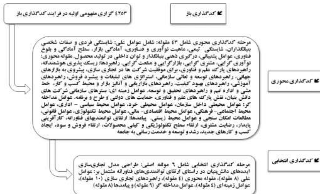
شکل ۱- فرآیند دسته‌بندی و انتقال داده‌ها در سه مرحله کدگذاری

در نهایت، برای تجزیه و تحلیل داده‌ها مطابق شکل یک، در سه مرحله کدگذاری باز (مطالعه پدیده از طریق جذب کردن اطلاعات و شکل‌بندی مقوله‌ها)، کدگذاری محوری (انتخاب یک مقوله کدگذاری باز که بر اساس تحلیل داده‌ها بیشترین