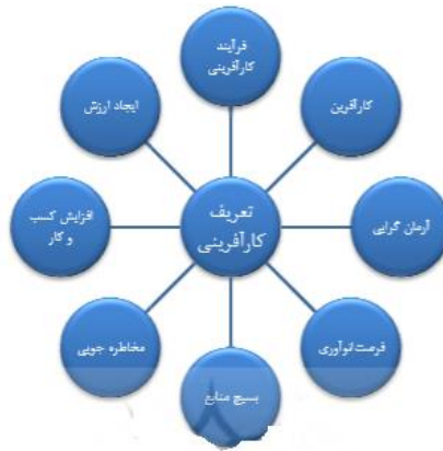
شکل ۱- تعریف کارآفرینی Figure 1. Entrepreneurship

کارآفرینی و کارآفرینان منشأ آثار ارزشمندی هستند که عبارت هستند از (۱) ایجاد اشتغال، رابطه تنگاتنگ کارآفرین و اشتغال به‌گونه‌ای است که تجارب کشورهای مختلف را تأیید می‌کنند که هرگاه فعالیت‌های کارآفرینی در یک جامعه کند و آهسته شوند، نرخ بیکاری آن جامعه فزونی خواهد یافت.