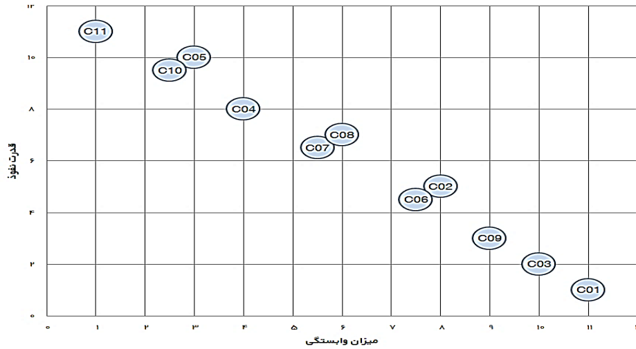
شکل ۳- نمودار قدرت نفوذ و میزان وابستگی (خروجی میک-مک). Figure 3. Penetration diagram and degree of dependence (Mick-Mac output)

در ادامه فرآیند مدل‌سازی ساختاری تفسیری، بر اساس روابط قدرت وابستگی و نفوذ عوامل کشف شده می‌توان دستگاه مختصاتی در چهار قسمت مساوی به نام‌های عوامل